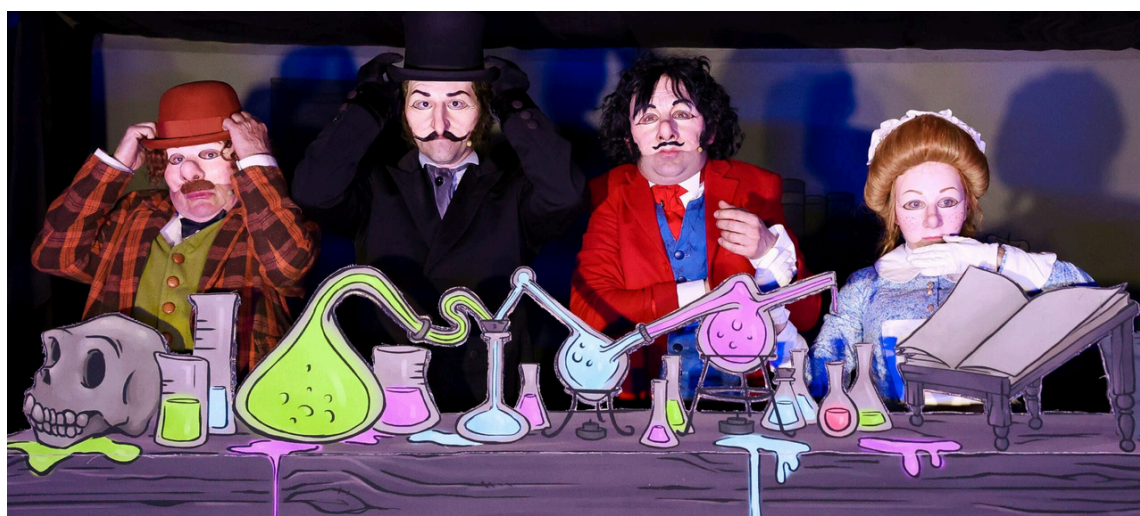
L'étrange Cas du Docteur JEKYLL et de Monsieur HYDE - création 2021