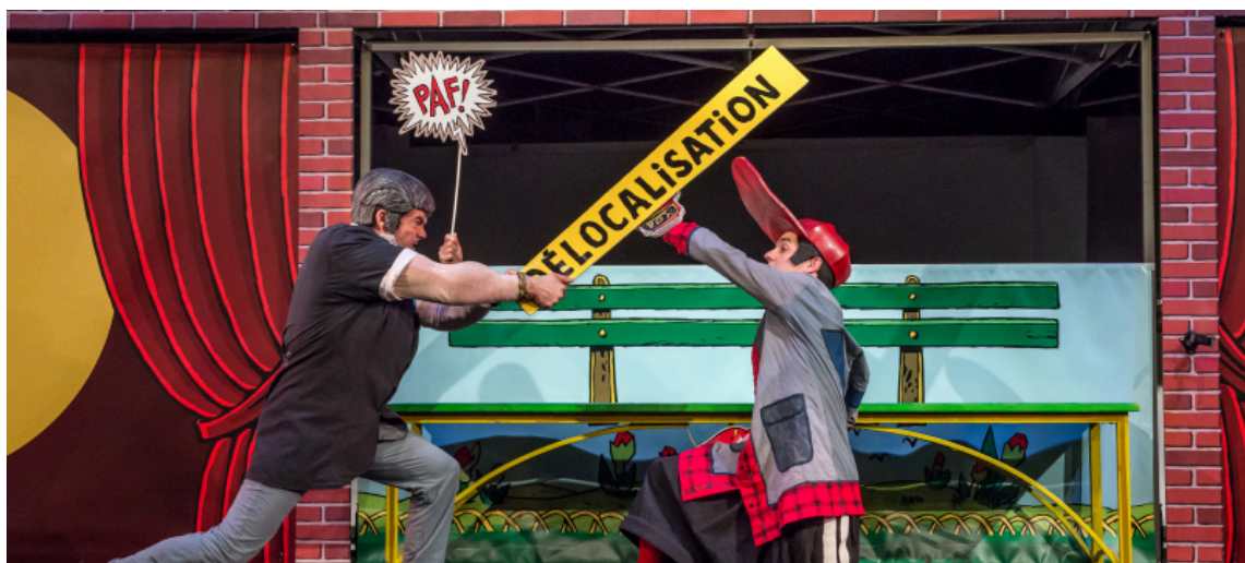
eCOnoMIC STRIP - création 2015