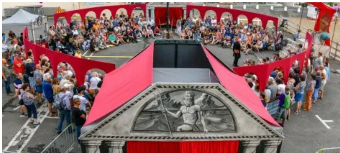
Le Grand Cirque des Sondages - création 2018